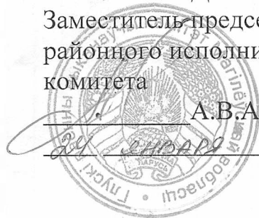
График проведения общих собраний с собственниками по вопросам организации энергоэффективных мероприятий по Глусскому УКП «Жилкомхоз»